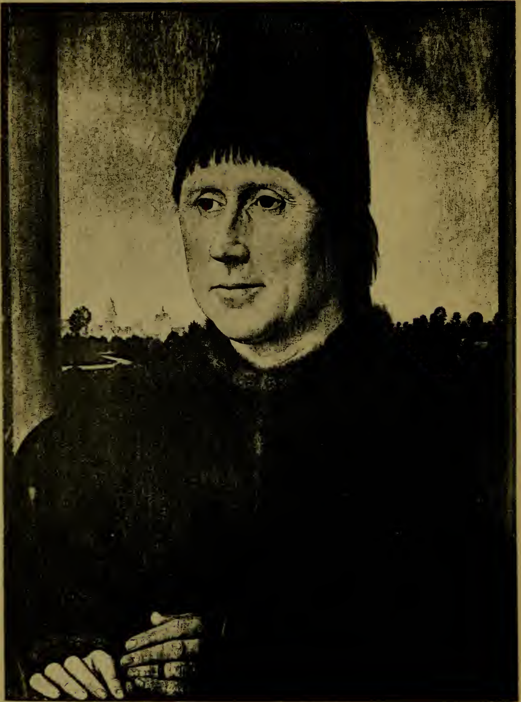
Portrait de Hans Memling.